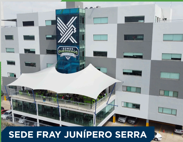
SEDE FRAY JUNÍPERO SERRA